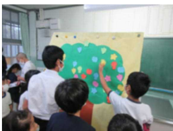
カードを貼っている様子

12月2日（金）に人権集会を行いました。これまで友達からしてもらったうれしいことを、カードに書いて紹介しました。たくさんのスマイルが集まり、素敵なスマイルツリーができました。