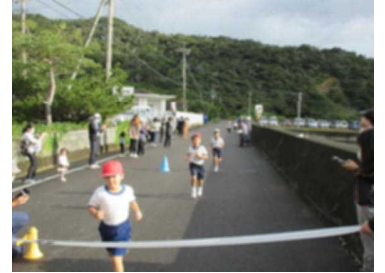
ゴールする子供たち

10日（土）、天候に恵まれとてもよいコンディションの中、校内ロードレース大会を実施しました。自分の目標に向けて、どの子も一生懸命走りました。保護者や地域の皆様、沿道での御声援ありがとうございました。