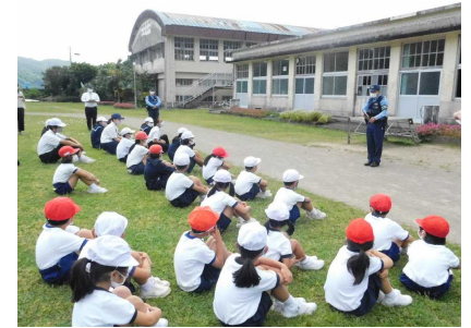
おまわりさんの話を聞く児童生徒

以下の小学生は、主に横断歩道の渡り方を指導していただきました。きまりを正しく守り一つしかない命を大切にしてほしいと思います。