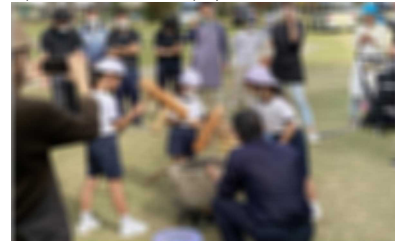
もちをつく小学生

1月14日（土）に家庭教育学級が主催する「餅つき大会」がありました。土曜授業終了後、子供達は体育館へ。杵（きね）をもつての餅つき、小学生から中学生まで、みんなでつきました。そして、自分たちで丸めて、その後、みんなでおいしくいただきました。終始、笑顔があふれるいい雰囲気での餅つきでした。保護者の皆様には道具や材料等の準備から当日のお手伝いまで、子供達のためにありがとうございました。子供達にとって、楽しい思い出の一つになったと思います。